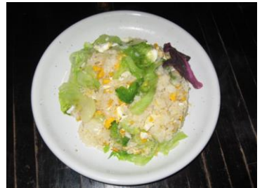
☆レタスチャーハン ¥800