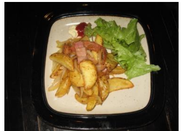
☆ジャーマンポテト ¥600