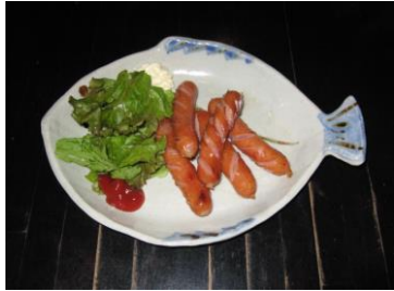
☆炒め (ポイル) ウインナー ¥600