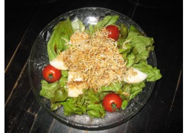
☆カリカリジャコのせ 大根サラダ ¥500